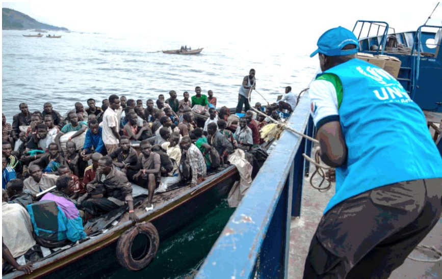
Refugiados chegam em barco lotado; foto da exposição "FACES DO REFÚGIO"

Desse total, quase 26 milhões são considerados refugiados pelos padrões do Acnur. Síria e Venezuela são pontos de preocupação da agência. Pedidos de refúgio no Brasil dobraram em um ano.